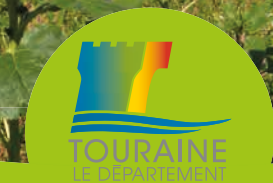
impression et réalisation : Impression Cd 37, édition juillet 2017, Extrait du Scan 25 convention IGN/400970 - n°52